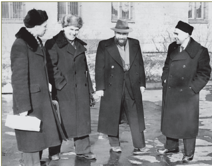
Коллеги. Март 1959 г.