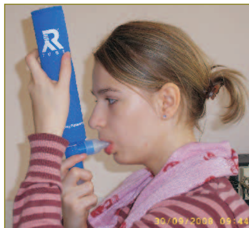
Рис. 1. Процедура сбора конденсата выдыхаемого воздуха с использованием устройства R-tube

Сбор конденсата выполнялся в утренние часы с использованием устройства сбора КВВ R-tube (Respiratory Research, США), исключающего загрязнение собираемого конденсата слюной (рис. 1).