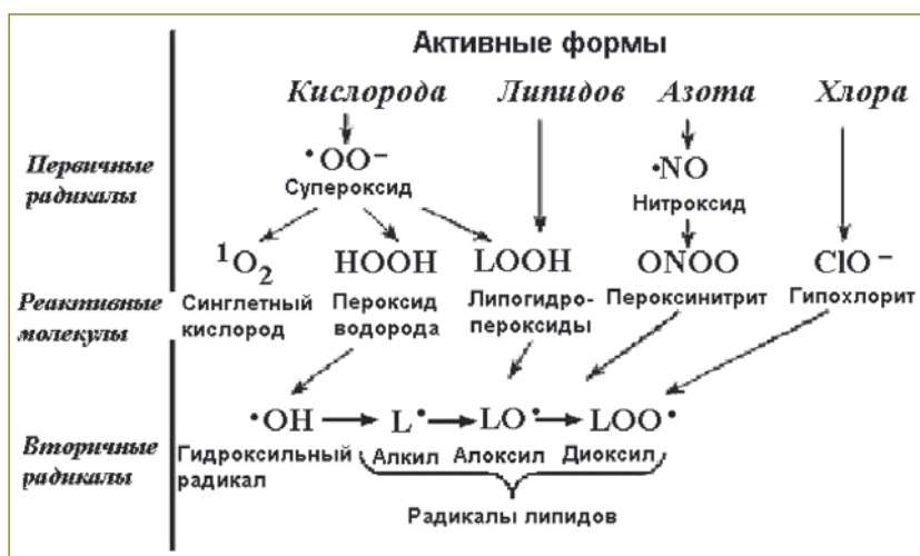
Рис. 1. Классификация биорадикалов [3]

Синглетный кислород — общее название для двух метастабильных состояний молекулярного кислорода с