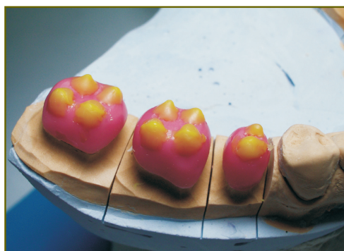
Рис. 4. Вестибулярные и язычные скаты щечных бугорков и щечные и язычные скаты язычных бугорков нижних боковых зубов