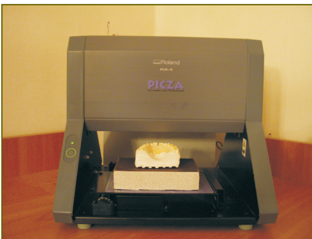
Рис. 1. Трехмерный контактный сканер ф. Roland DG Corporation, модель PIX-4

Материалы и методы. Для изучения возрастных изменений окклюзионной поверхности мы применяли методику трехмерного контактного сканирования. Она позволяет обследовать любой объект и создать цифровое 3D-изображение, которое может редактироваться и обрабатываться на персональном компьютере. В работе использовался трехмерный контактный сканер PIX-4 ф. Roland DG Corporation (рис. 1).