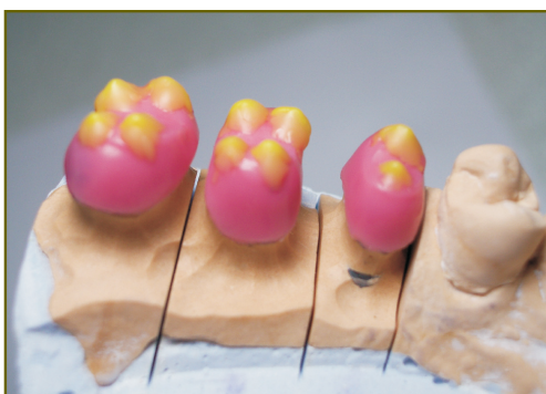
Рис. 3. Вестибулярные и небные скаты щечных бугорков и щечные и небные скаты небных бугорков верхних боковых зубов

Контрольные боковые движения в артикуляторе должны быть беспрепятственными. В центральной ок-