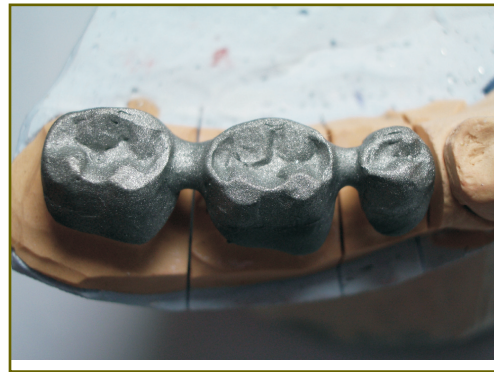
Рис. 8. Каркас металлокерамического протеза с индивидуально оформленной окклюзионной поверхностью