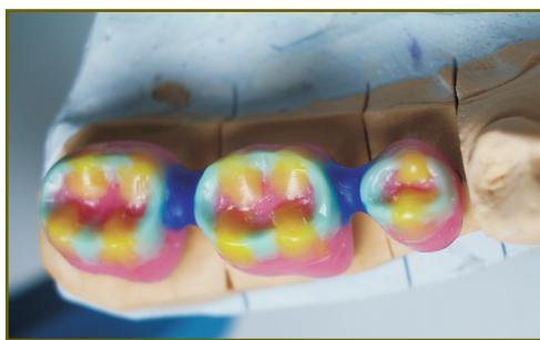
Рис. 6. Мезиальные и дистальные скаты щечных и язычных бугорков нижних боковых зубов