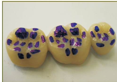
Рис. 9. Металлокерамический мостовидный протез, изготовленный по нашей методике

Изначальное моделирование фасеток стирания и воспроизведение углов дивергенции скатов боковых зубов на восковых репродукциях несъемных протезов позволяет, после процесса литья, получить каркасы уже с индивидуально оформленной, согласно ее возрастным изменениям, окклюзионной поверхностью (рис. 8).