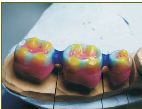
Рис. 7. Фасетки стирания и углы дивергенции скатов бугорков боковых зубов

Контроль окклюзионных контактов в артикуляторе проводили в следующей последовательности: в центральной окклюзии, в задней контактной позиции, при скольжении по центру, в правой боковой окклюзии, при скольжении из центральной окклюзии в правую боковую окклюзию, в левой боковой окклюзии, при скольжении из центральной окклюзии в левую боковую окклюзию, в передней окклюзии, скольжение из центральной окклюзии в переднюю окклюзию.